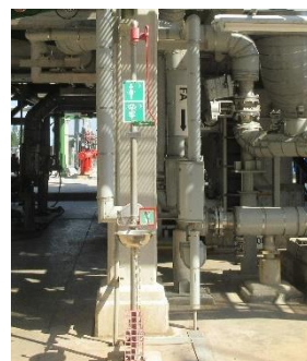
ภาพที่ 2-29 อ่างล้างตาและร่างกายฉุกเฉิน