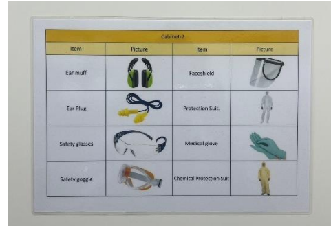
ภาพที่ 2-11 ป้ายเตือนให้สวมใส่อุปกรณ์ป้องกันอันตรายส่วนบุคคล