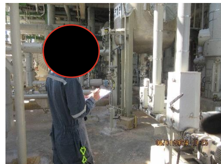
ภาพที่ 2-6 พนักงานเดินตรวจตรา