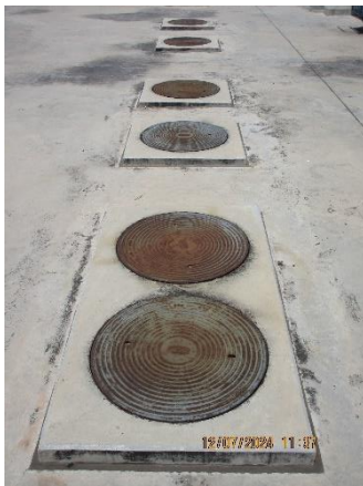
ภาพที่ 2-14 ถังบำบัดน้ำเสียสำเร็จรูป