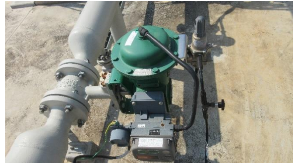
ภาพที่ 2-9 วาล์วระบายความดันที่ท่อเผา/วาล์วฉุกเฉิน