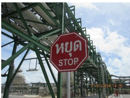
ภาพที่ 2-21 ป้ายเตือนและสัญลักษณ์การจราจร