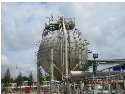
ภาพที่ 2-7 ถังเก็บ 1,3-บิวทาไดอิน