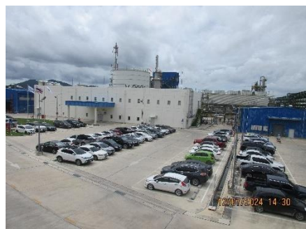
ภาพที่ 2-20 พื้นที่จอดรถ