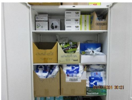
ภาพที่ 2-28 อุปกรณ์คุ้มครองความปลอดภัยส่วนบุคคล (PPE)