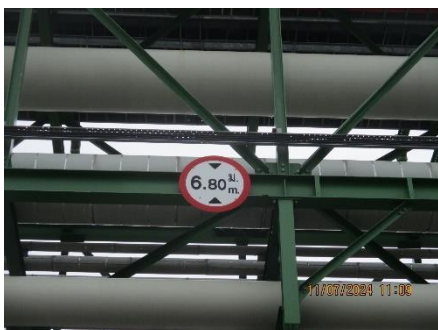
ภาพที่ 2-35 ป้ายบอกความสูงของ Pipe Bridge