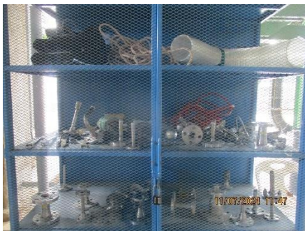
ภาพที่ 2-5 อุปกรณ์และอะไหล่สำรองของเครื่องจักร