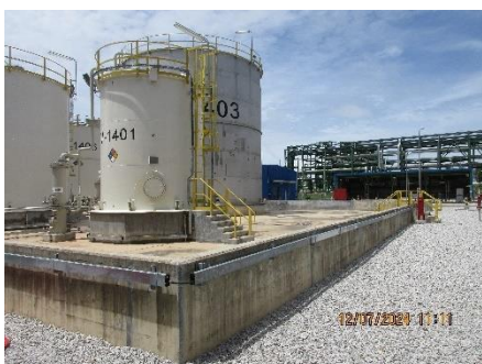
ภาพที่ 2-33 คันกั้นคอนกรีตล้อมรอบลานถังเก็บกัก