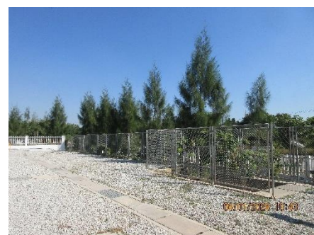
ภาพที่ 2-39 พื้นที่สีเขียวภายในโครงการ