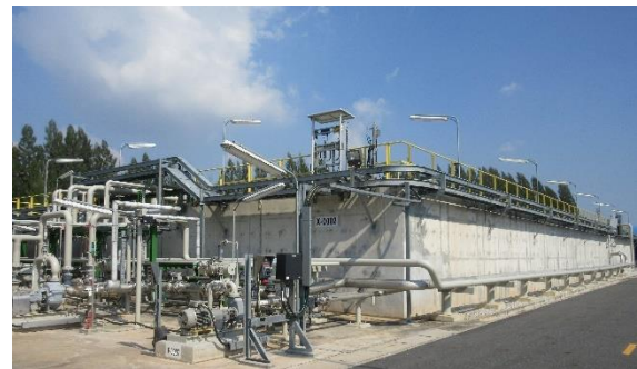
ภาพที่ 2-13 ระบบบำบัดน้ำเสีย ชุดที่ 2