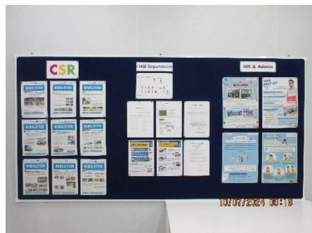
ภาพที่ 2-27 ป้ายหรือบอร์ดประชาสัมพันธ์