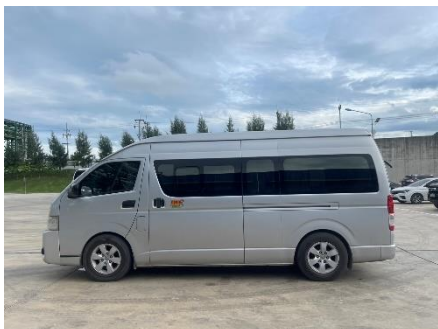
ภาพที่ 2-23 รถรับส่งพนักงาน