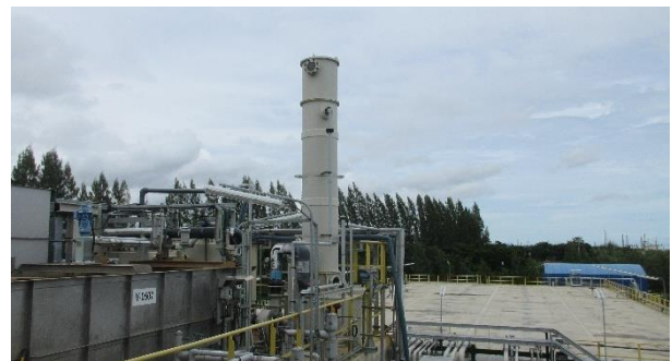
ภาพที่ 2-15 หน่วยบำบัดกลิ่นแบบสครับเบอร์ จำนวน 2 ชุด