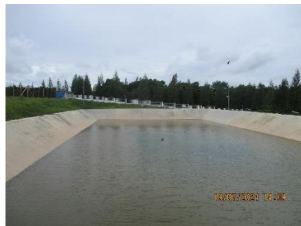
ภาพที่ 2-18 บ่อหน่วงน้ำฝน