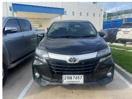
ภาพที่ 2-38 รถรับส่งผู้ป่วยในกรณีฉุกเฉิน