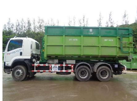
ภาพที่ 2-25 อาคารเก็บพักของเสียและรถขนกากของเสีย