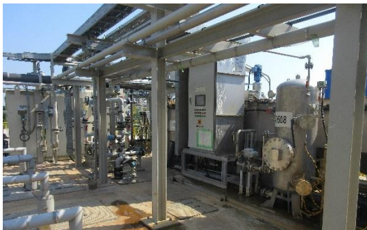
ภาพที่ 2-12 ระบบบำบัดน้ำเสีย ชุดที่ 1