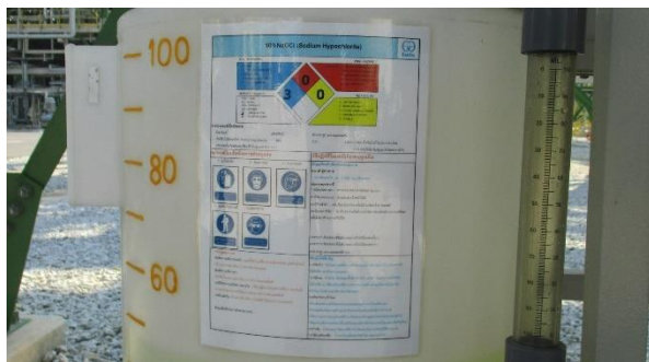
ภาพที่ 2-31 เอกสารข้อมูลความปลอดภัยเคมีภัณฑ์ (SDS)