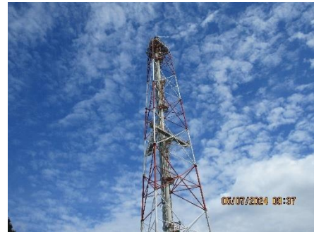
ภาพที่ 2-2 ระบบหอเผา