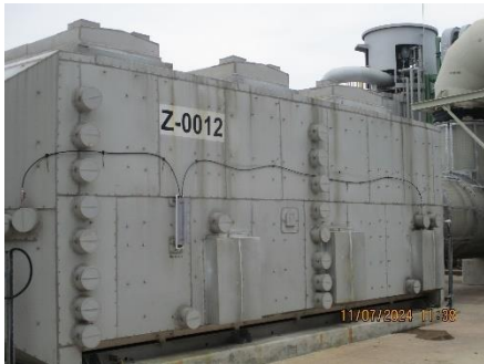
ภาพที่ 2-1 ระบบเอสซีอาร์