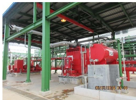
ภาพที่ 2-30 ระบบและอุปกรณ์ความปลอดภัยต่างๆ