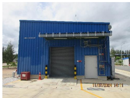
ภาพที่ 2-32 อาคารเก็บสารเคมี