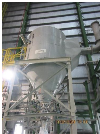
ภาพที่ 2-3 เครื่องดักฝุ่นแบบ Cyclone Separator