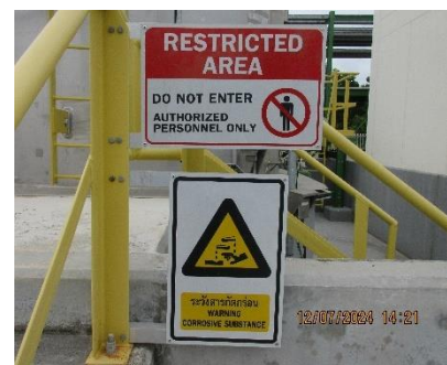
ภาพที่ 2-10 ป้ายเตือนพื้นที่อันตรายต่อการปฏิบัติงาน