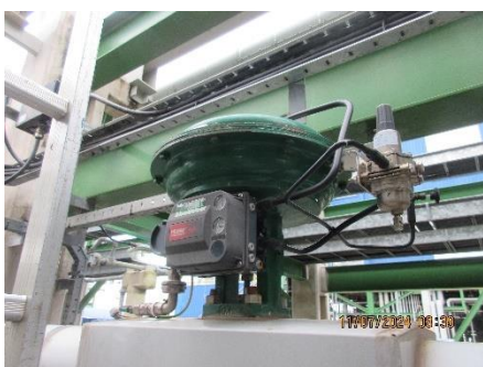
ภาพที่ 2-36 ติดตั้งปลั๊กควาล์วที่ท่อ และเครื่องตรวจวัดอัตราการไหล