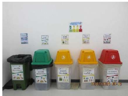
ภาพที่ 2-24 ถังรองรับขยะมูลฝอย (แยกประเภท)