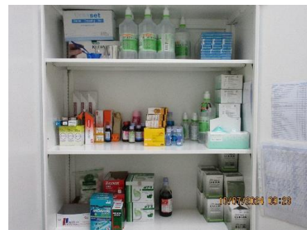
ภาพที่ 2-37 ห้องพยาบาล เวชภัณฑ์และอุปกรณ์ปฐมพยาบาลเบื้องต้น