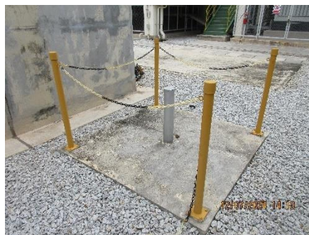
ภาพที่ 2-16 บ่อสังเกตการณ์