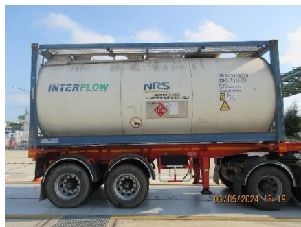
ภาพที่ 2-22 รถขนส่งสารเคมี