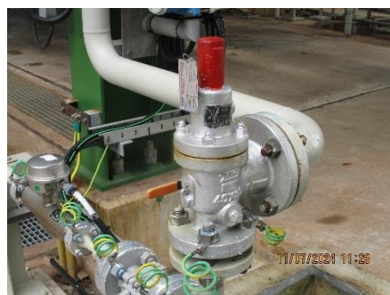
ภาพที่ 2-34 วาล์วนิรภัย