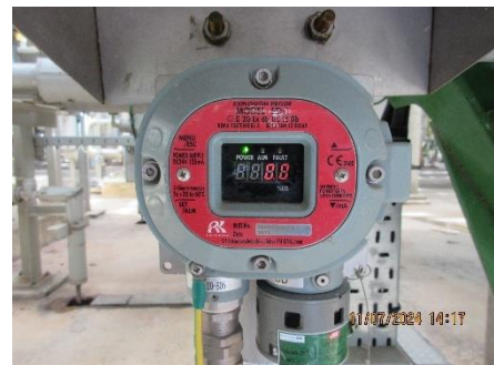
ภาพที่ 2-8 Gas Detector