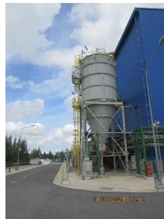
ภาพที่ 2-4 เครื่องดักฝุ่นแบบ Bag Filter