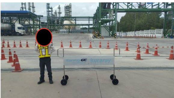
ภาพที่ 2-19 เจ้าหน้าที่รักษาความปลอดภัย